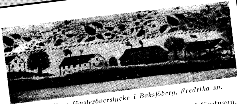
Bild 2. Detalj av fönsteröverstycke i Baksjöberg, Fredrika sn.

alltid ett vaktdjur, en hund, ett lejon, en slagörn, i förstugan. De frihandsmålade partierna kunde variera mycket motiviskt. Ofta uppges det att han målade landskap med hus, djur av olika slag, blommor, böcker, svärd, stjärnor och inte minst porträtt. Mycket av detta har inte ännu kunnat beläggas i kända verk av honom men tillräckligt mycket för att visa, att traditionen varit pålitlig.