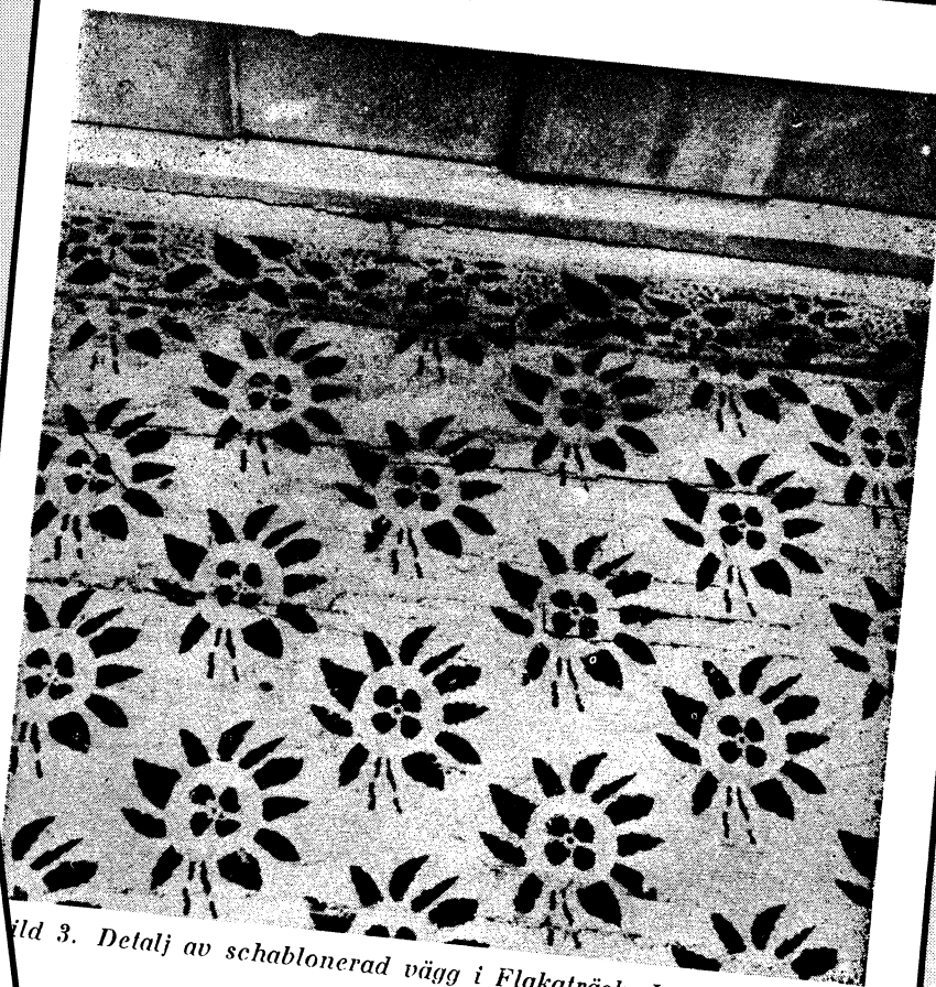
Bild 3. Detalj av schablonerad vägg i Flakaträsk, Lycksele sn.

malade med svart konturschablon omväxlande med frihandsmålade träd i ett antytt kulligt landskap. Över dörren har nämligen suttit en »tavla» med bondens och hans hustrus ansikten men den är bortrivnen. Kökskammaren har slingmålade paneler och däröver två blomschabloner i grönt och rött. Förskåmmaren har ovanför panelen samma frihandsmålade dekoration som köket, men på ett par starkt skadade ställen kan man urskilja två grupper av schablonerade hus i enkla landskap med träd, kullar och sjöar. Ena är som i köket försett med ett överlagt vitt och rött