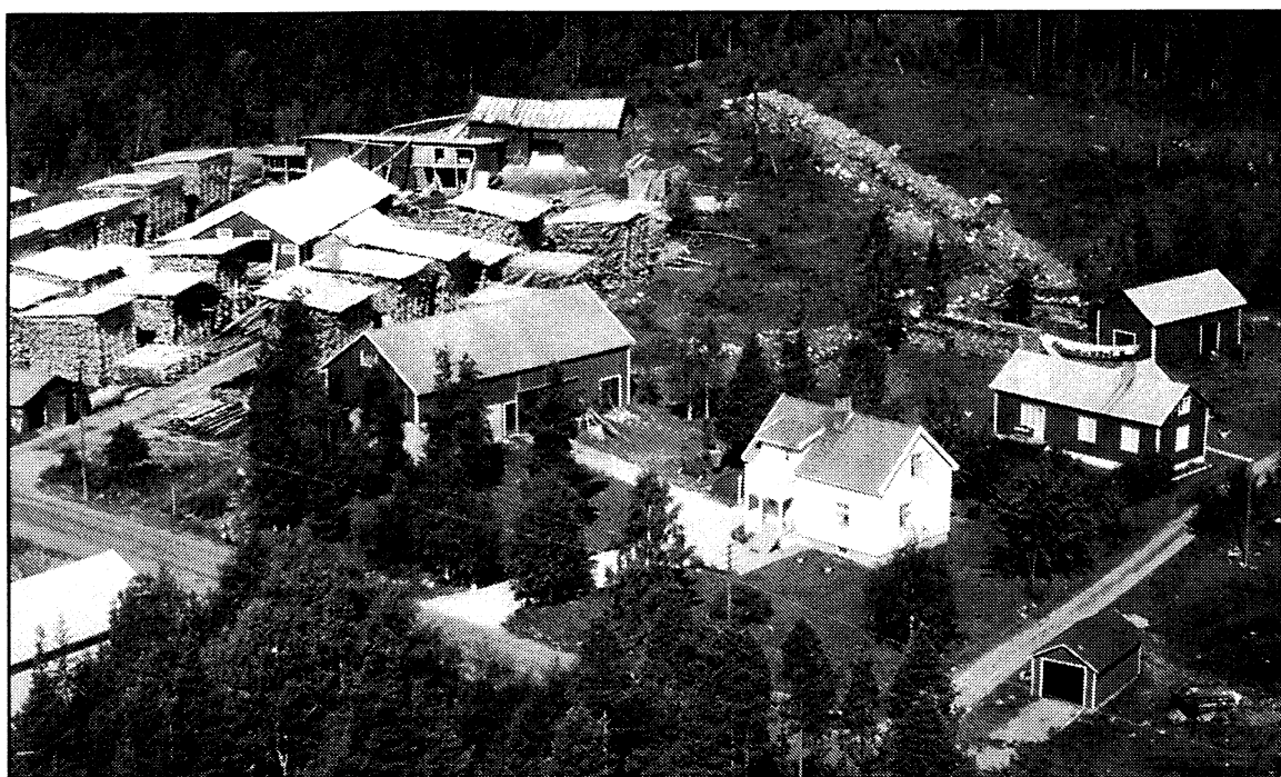
•En vy från luften över Yttersjö-sågen. Tagen på 50-talet.