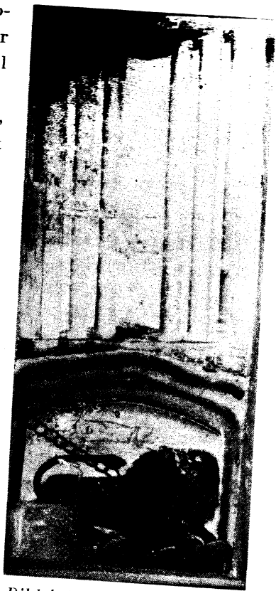
Bild 4. Vaktdjur i förstugan. Målning på papper, Flakaträsk, Lycksele sn.

I Baksjöberg, Fredrika socken, finns ett kök som är mycket likt det i Liden. Samma på fri hand utförda slingmåleri, samma fönsteröverstycken med schablonerade husrader vilka verkar som en framtidsvision av vår tids hyreshus (bild 2). Men här finns tavlan ovanför dörren bevarad. Dess placering och innehåll är traditionella, där står: »B Bg PODS år 1861 EMN-doter». Över dessa ägarinitialer ett draperi och ett blomsterornament med två fåglar, allt målat med elegans och